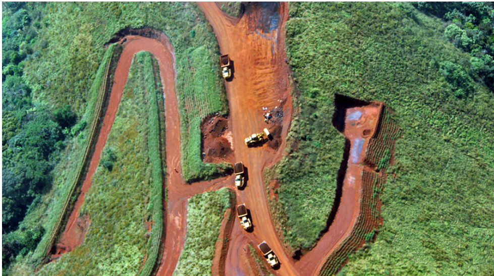
Le projet Simandou en Guinée, l'un des plus grands gisements de minerais de fer au monde, au cœur des enjeux géo-économiques africains.