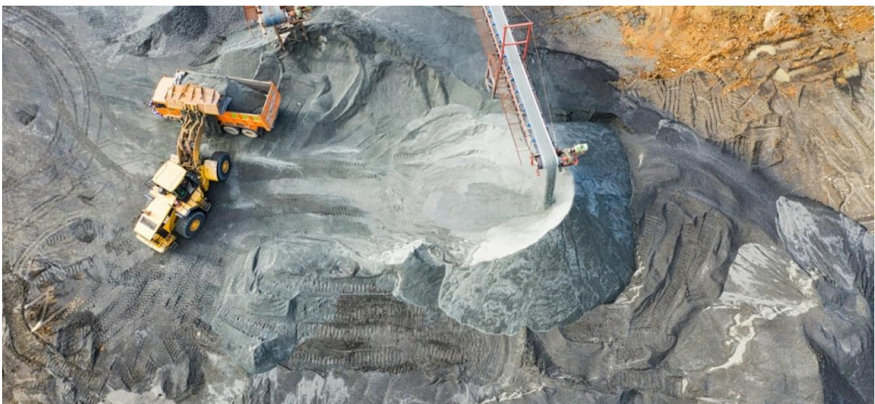
Les ressources minérales de l'Afrique subsaharienne représentent environ 30 % des réserves mondiales en minerais critiques.

Par Ahmed Omar & Timon Costa, M2 Intelligence Économique · IAE de Poitiers VeilleMag