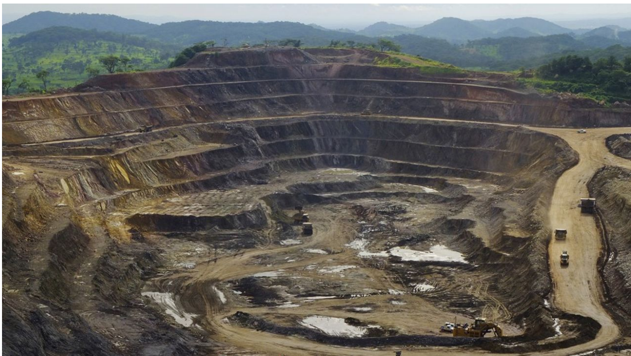
Mine de cuivre et de cobalt de Tenke Fungurume, RDC, 110 km au nord-ouest de Lubumbashi. La RDC assure 75 % de la production mondiale de cobalt.

Ces avancées ne seraient pas possibles sans une capacité informationnelle renforcée : comprendre les stratégies des multinationales, détecter les tentatives de captation, négocier en connaissance de cause des prix du marché mondial. L'IE n'est pas un outil annexe : c'est la condition sine qua non de la transformation d'une rente naturelle en puissance économique réelle.