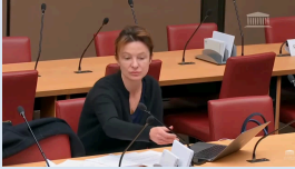
Audition de M. Roland Lescure, Ministre de l'Economie et des Finances Réponse du Ministre sur le contrôle IEF et la vente de LMB Aerospace